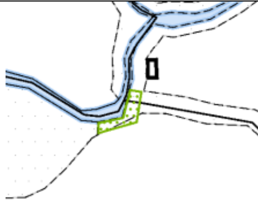
Gewässerraumfestlegung ergänzt aufgrund verkleinerten Waldes (Parzelle Nr. 523, 640)