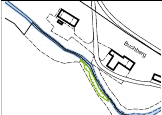
Gewässerraumfestlegung ergänzt aufgrund verkleinerten Waldes (Parzelle Nr. 524)