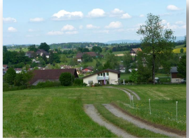
Blick auf Fridau