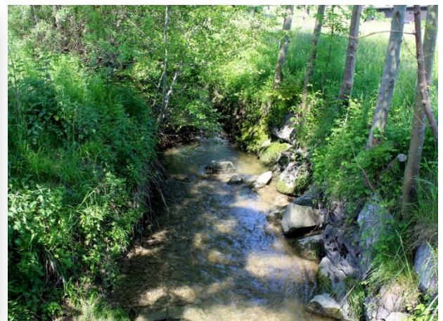
Sellenbodenbach beim Schützenhüsli