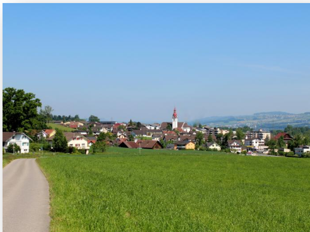
Blick von Fridau auf Neuenkirch