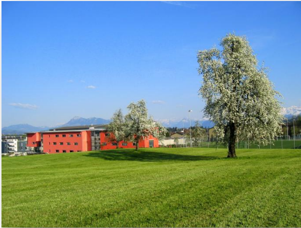
Blick von Krauerhus Richtung Dorf