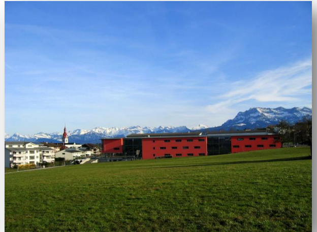
Blick auf das Schulhaus Grünau