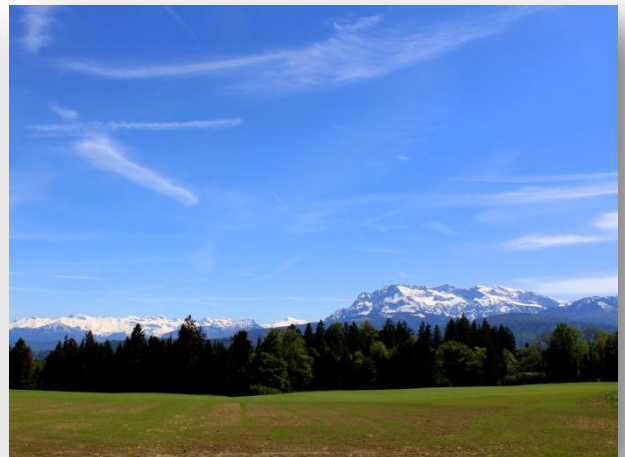
Schöne Aussicht auf Innerschweizer Berge