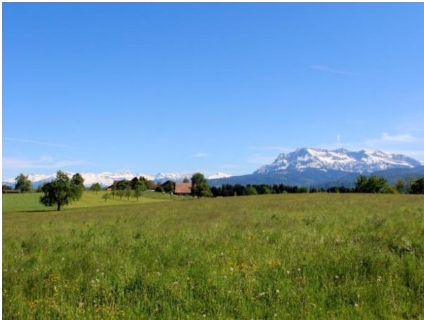
Blick von Sellenboden Richtung Innerschweizer Berge