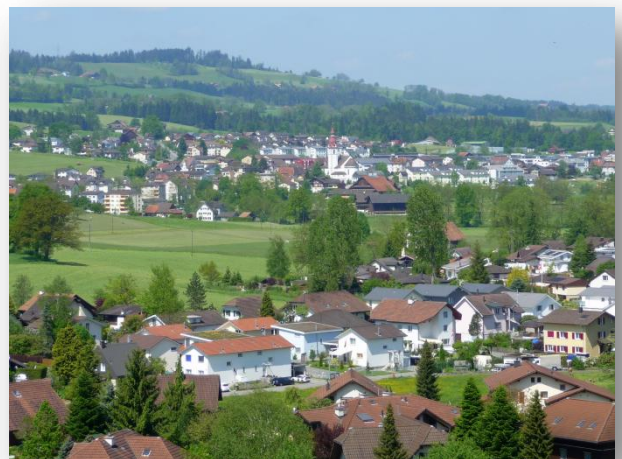
Blick von Rippertschwand Richtung Neuenkirch