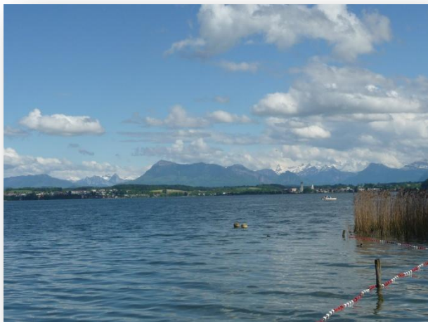
Blick auf See und Berge