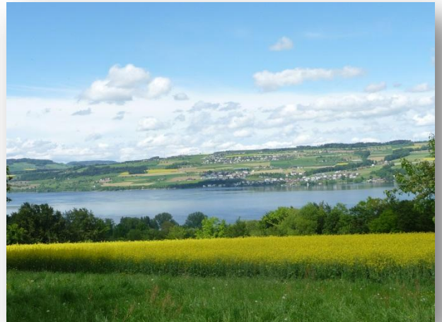
Blick auf Sempachersee