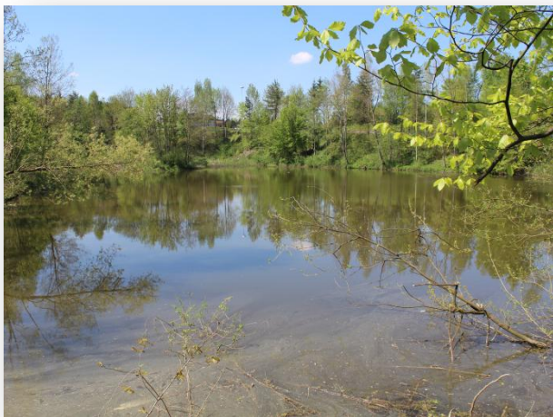
Naturweiher bei der Autobahnraststätte