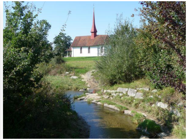
Flusslandschaft bei Adelwil