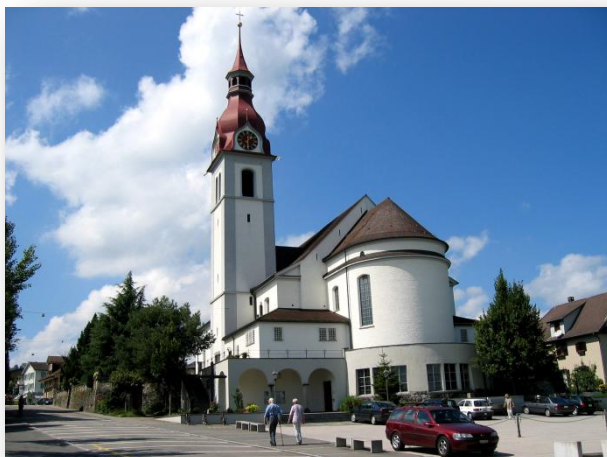
Pfarrkirche St. Ulrich Neuenkirch